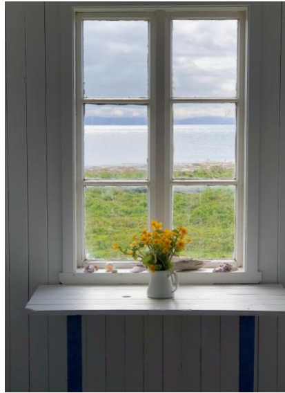
Fra fellesgangen i et av husene