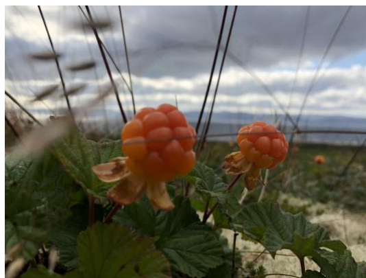
Kanskje blir det multer til dessert..