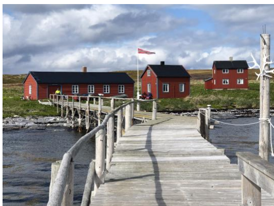
Innerenden med kaia og noen av husene

Opplev Sværholthavøya fra sjøsiden. Dette unike villmarksområdet byr på det meste. Vi gjør strandhogg i spektakulære Slottsvika, og kombinerer den friske RIB turen med overnatting på Tamsøya i autentiske omgivelser og nostalgi i veggene