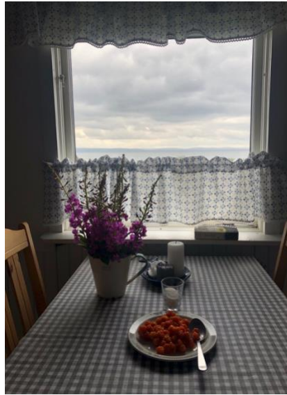
Fra et av rommene på Tamsøya