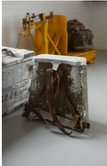
Måseegg, dun og gammel bæsekk.