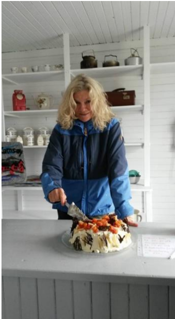
Multekake i «gammelbutikken