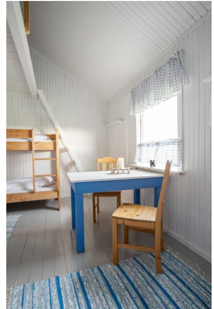
Et av rommene i Annelihytta

Det vil bli servert enkel lunsj midt på dagen, en kakebit og kaffe på ettermiddagen og ikke minst en femretters middag om kvelden. På søndag blir det felles frokost i den gamle bærstjåen.