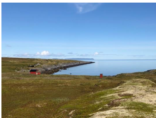
Kobbevika med utsikt mot Magerøya

Opplev Tamsøya i variert og magisk natur mens alle sanser påvirkes av vakre klippeformasjoner, fargerike blomster, bølgeskvulp, måkeskrik og vind i håret. Dette er en todagers vandretur som passer for 2-4 personer som reiser sammen. Hvis du vil oppleve et pusterom fra sivilisasjonen, få ødemarksfølelsen og noen dager helt fri fra stress er dette den perfekte turen.