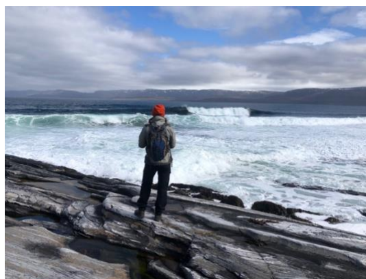
Surfebølger på Nordøstsiden med utsikt mot Sværholthavøya