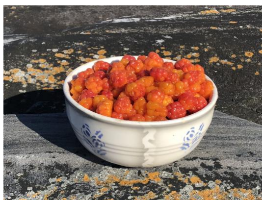
Gyldne bær i gammel porselensskål