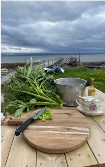
Sylting av Kvann