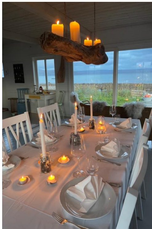
Dekket på til middag