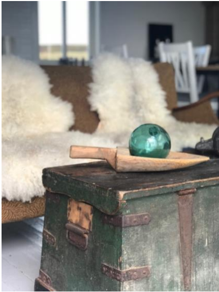
En reise tilbake i tid