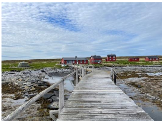
Innerenden med kaia og noen av husene

Opplev Sværholthalvøya fra sjøsiden. Dette unike villmarksområdet byr på det meste. Så fremst været tillater det, gjør vi strandhogg i spektakulære Slottsvika, og kombinerer den friske RIB turen med overnatting på Tamsøya i autentiske omgivelser og nostalgi i veggene