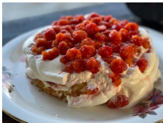
Kanskje blir det multer til dessert..