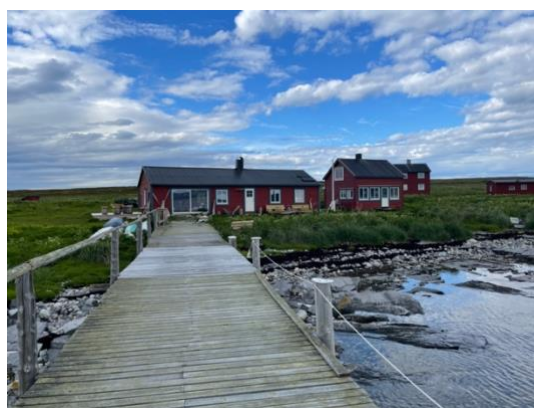
Kaia, Bærsjåen, Lillegården og Storgården