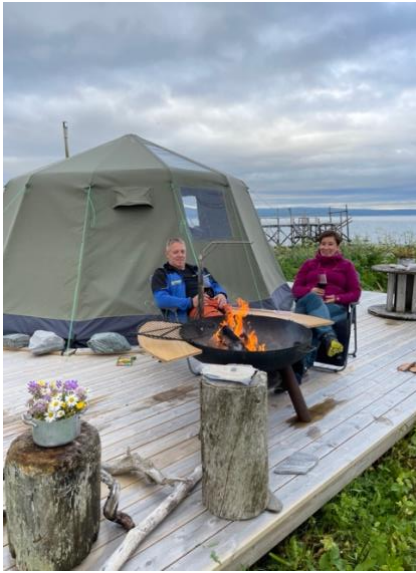
Venorgamme med egen terrasse