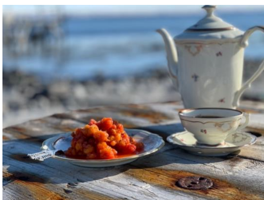
Multer og kaffe hører med 😊

Reis tilbake til 50 tallet, og få følelsen av å leve i en litt annen tid. Du bor enkelt, men trivelig på Tamsøya. Det er ikke strøm og innlagt vann, så her fyrer man med ved og tar oppvasken for hånd. På Tamsøya kan du velge mellom å bo i husene på Innerenden helt sør på øya der kaia og mesteparten av bebyggelsen står, eller i våre to sjarmerende hytter i Kobbavika og Hellemolla. I tillegg kan du bo i Venorgamme på sørsiden av øya. Selv om du lever i pakt med naturen, er teltgammene godt utstyrt med alt man trenger for å ha det komfortabelt.