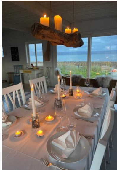
Dekket opp til middag i Bærstjåen