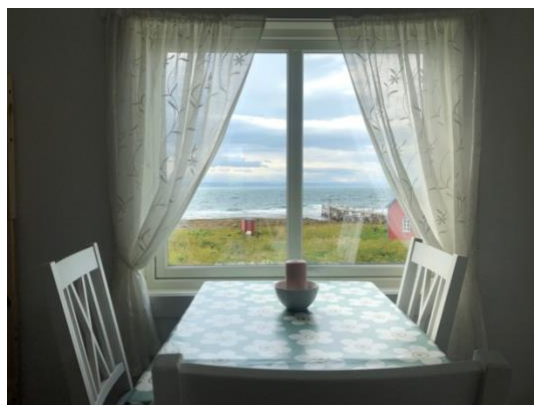
Utsikt fra Storgården