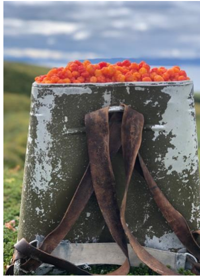
Aluminiumssekke fra 70-tallet