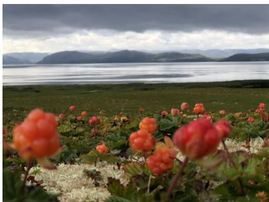
Multemyr på Vestsiden av øya

Sommerens vakreste eventyr! Hvert år samles over 100 entusiastiske bærplukkere på Tamsøya for å sikre seg multebær av beste kvalitet i naturskjønne omgivelser fordelt på 14 hektiske dager. Vi selger multebær både til privatpersoner og bedrifter. Tamsøybæra er populær og viden kjent for sin farge, størrelse og smak, så det lønner seg å være tidlig ute med bestillingen både hvis du ønsker å plukke bær selv eller kun kjøpe bær.