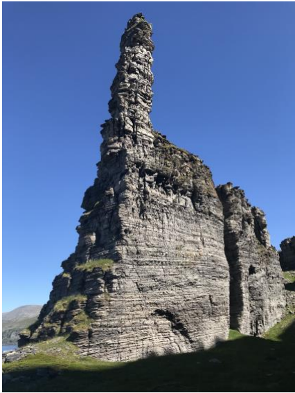
Tårnet i Slottsvika