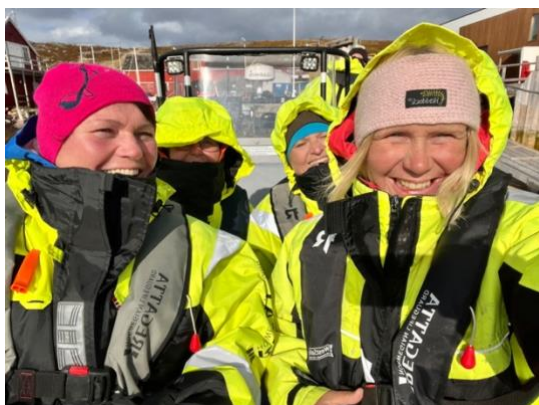
God stemning på RIB turene våre

Opplev den mektige Porsangerfjorden og Sværholthavøya fra sjøsiden. Dette unike villmarksområdet byr på det meste. Så fremst været tillater det, gjør vi strandhogg i spektakulære Slottsvika, og kombinerer den friske RIB turen med et kort stopp innom Tamsøya.