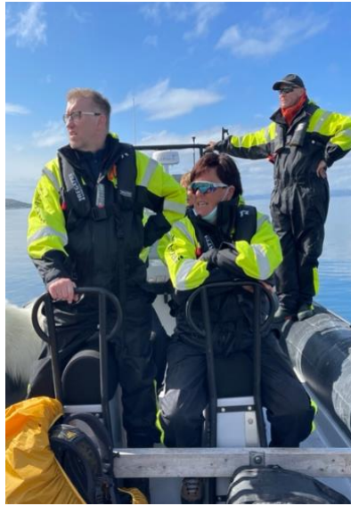
Guiding langs Sværholtalvøya