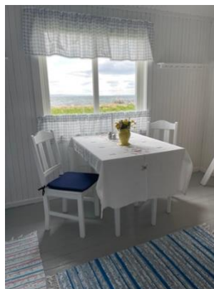
Et av rommene i Annelihytta